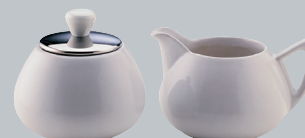
■ sucrier et crémier