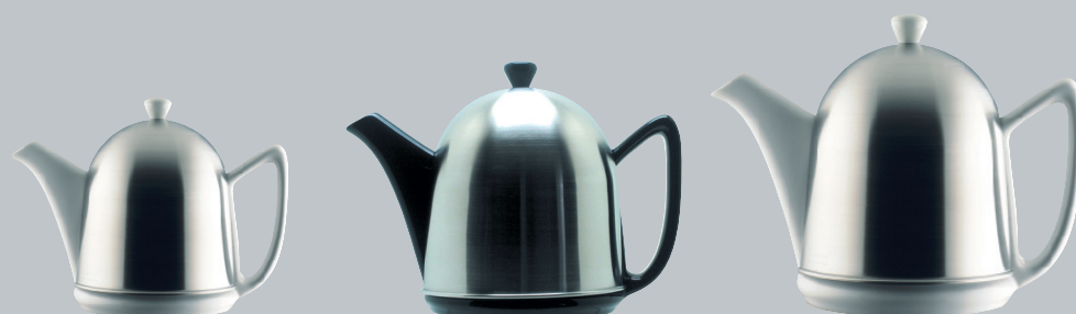
■ Cosy® Manto mat