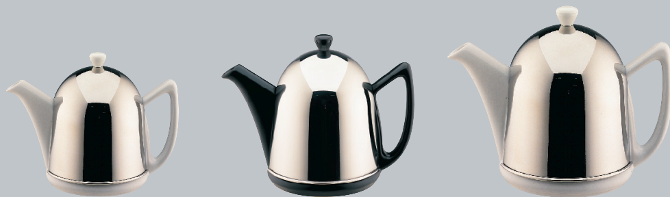
■ Cosy® Manto brillant